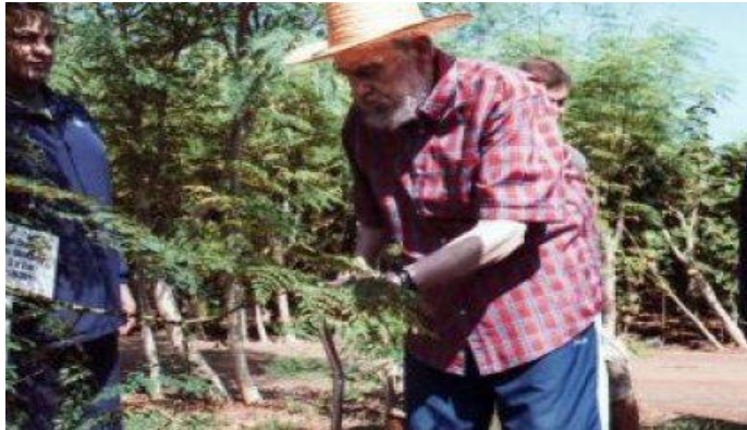
(Fidel Castro la utiliza en su alimentación y reconoce sus beneficios)

Recientemente se hecho más popular y conocido este milagroso árbol dado que Fidel Castro ha declarado que ha podido mantener su salud gracias a los beneficios nutricionales de este árbol.